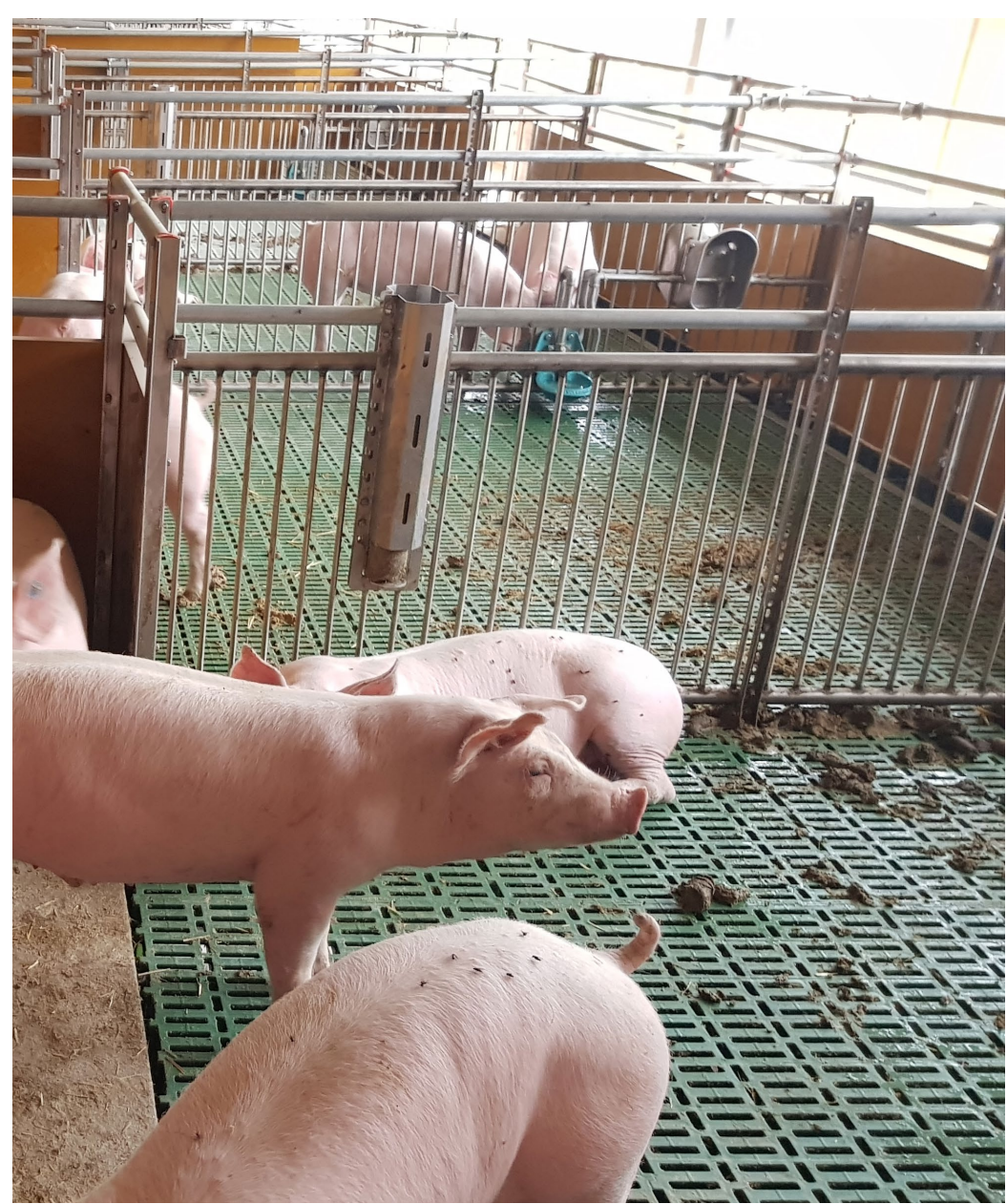
Abbildung 3: Mistenbereich mit Kunststoffrosten