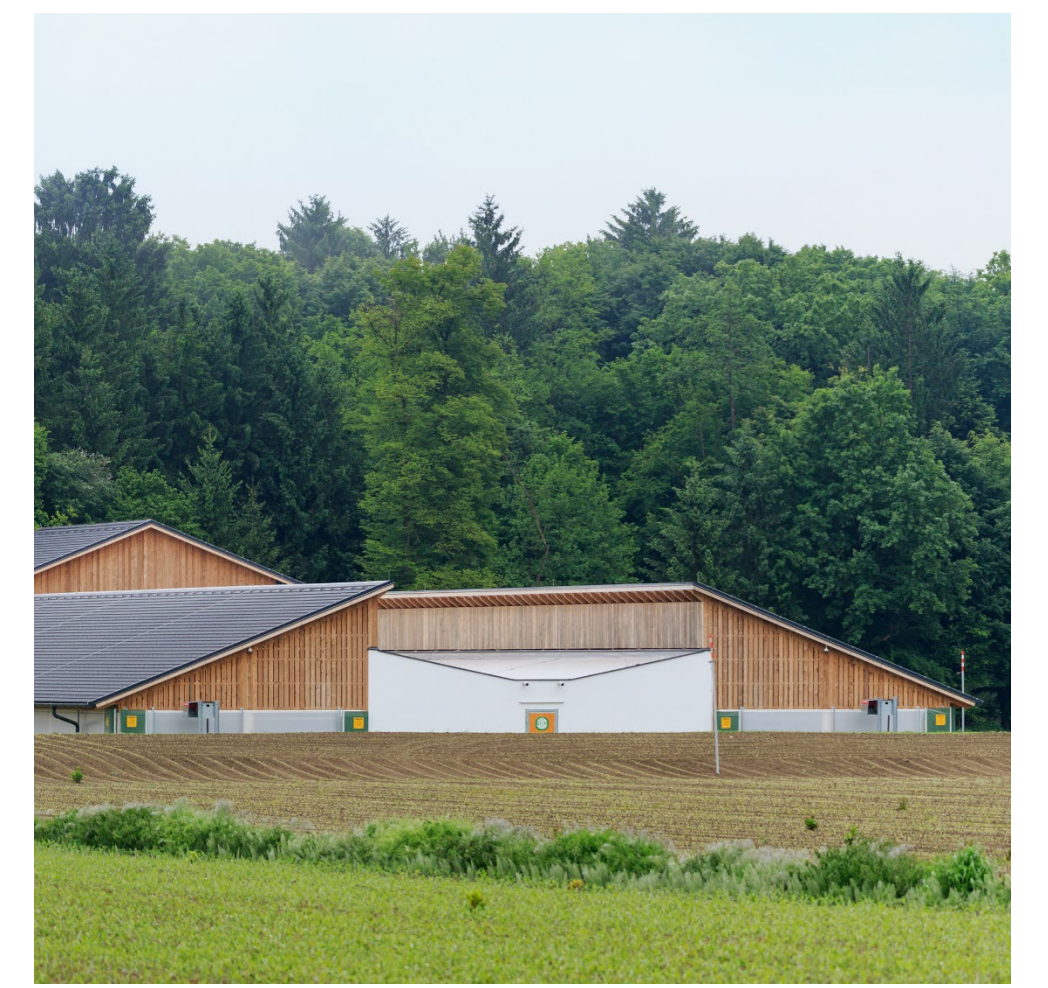
Abbildung 2: Praxisstall in der Steiermark (AT)