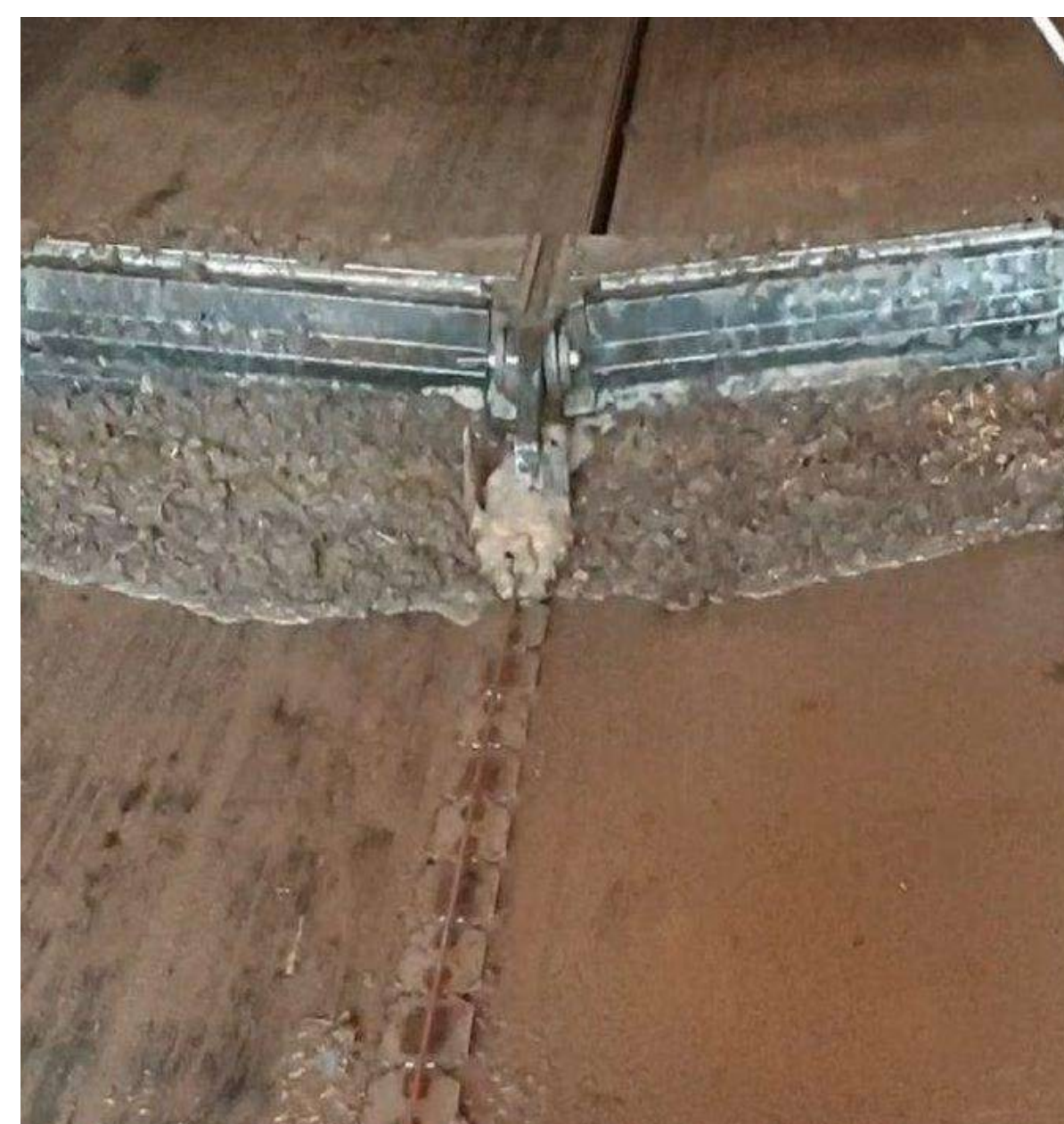
Abbildung 4: Kotschieber mit Urinrinnenabdeckung