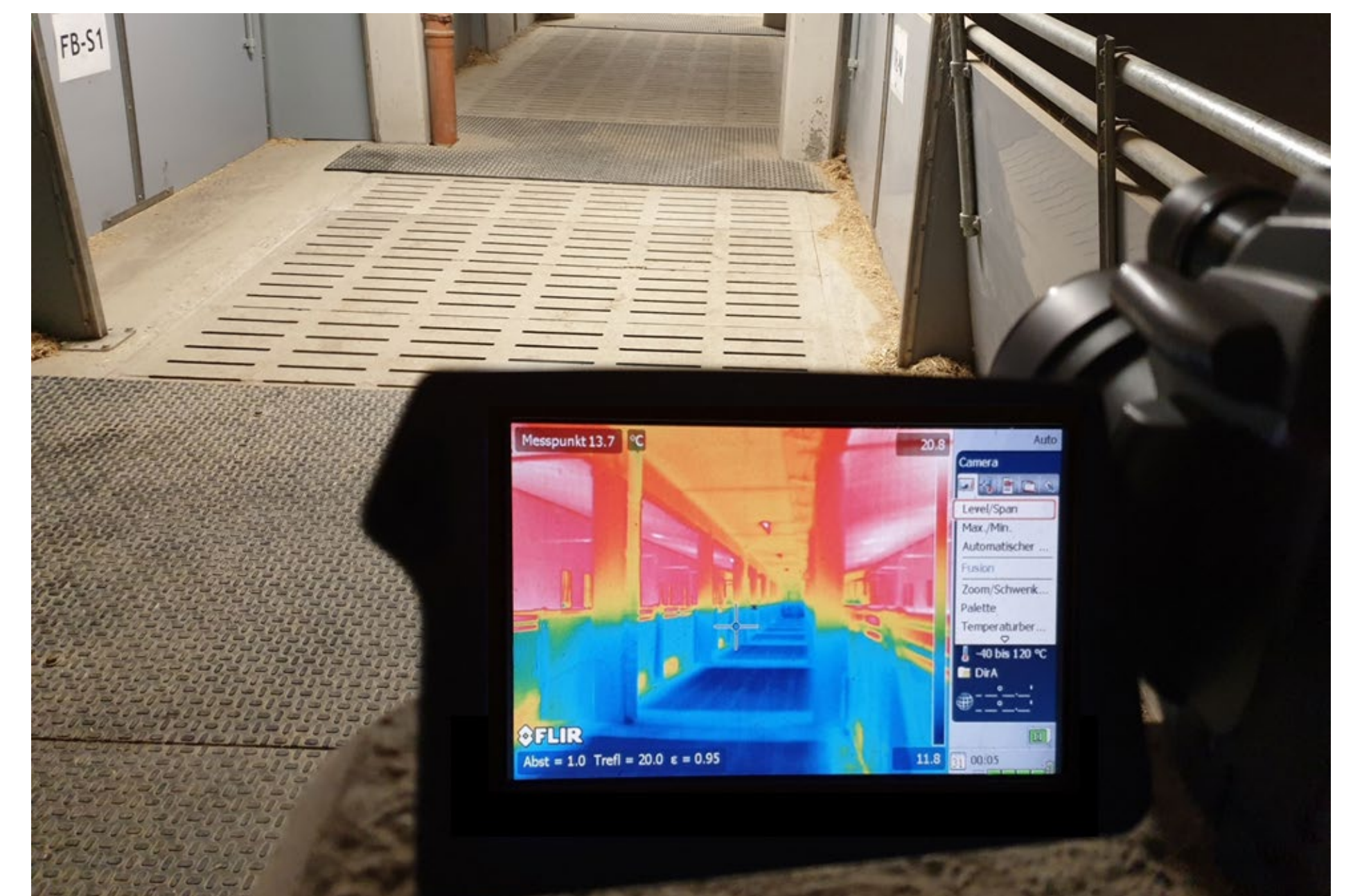
Abbildung 5: Wärmebild des Komfortbereiches mit einströmender Frischluft (blau) über den Mittelgang und aufsteigender Warmluft (gelb-rot)

Der gekapselte, wärmedämmte und planbefestigte Innenbereich dient bei diesem Konzept als Komfort- und Liegebereich. Er beinhaltet die nach oben offen gehaltenen und eingestreuten Liegebuchten. Mittig befindet sich ein Kontrollgang. Durch den Komforteffekt, der durch Heizung, Kühlung, Einstreu sowie frische und staubfreie Luft gekennzeichnet ist, kann die Verschmutzung (Anlegen von Kotecken oder Exkremementsuhlen) der planbefestigten Bereiche der Bucht weitgehend vermieden werden. Die Tierbesatzdichte ist ausgelegt auf ca. 1,1 bis 1,5 m 2 /Tier, was etwa 20 bis 25 Tieren pro Bucht entspricht. Zur Verhinderung der Überhitzung des Liegebereiches im Sommer und zur Verhinderung des Abkotens / Urinierens muss die Komfortzone unbedingt mit einer Kühlung ausgestattet werden. Dies erfolgt mit einem Kühlungssystem, das mit im Unterflurbereich des Stalles verbauten Kühlkissen / Coolpads realisiert wird (Abbildung 5).