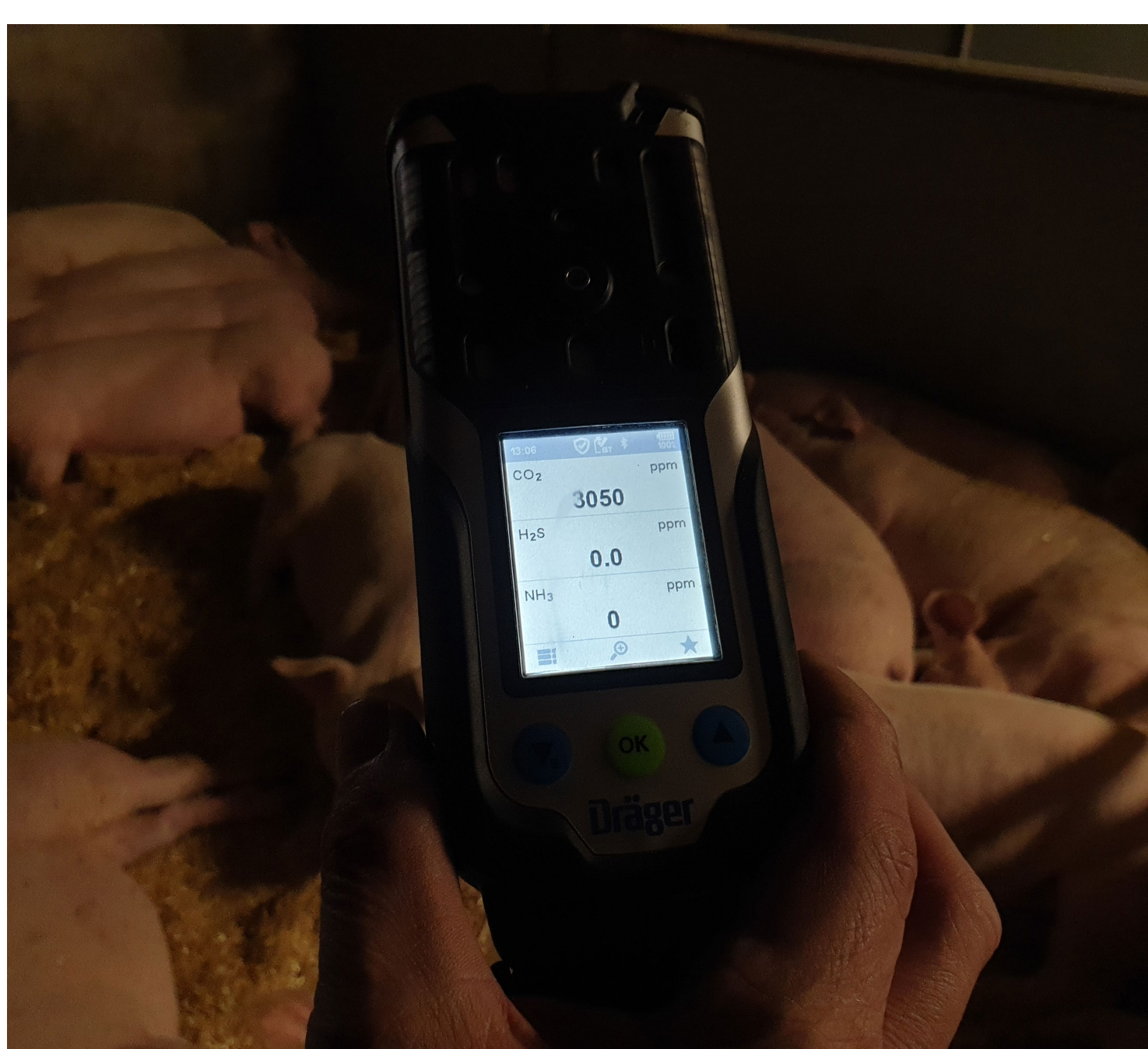
Abbildung 6 und 7: Die Sauberkeit der Buchten ermöglicht Tierwohl und niedrigste Ammoniakemissionen